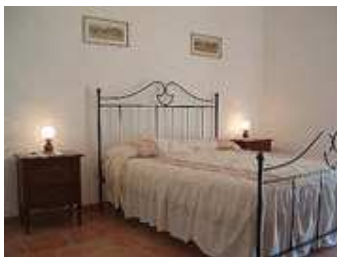
Bedroom – Camera Letto