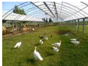
Tacchini e Faraone