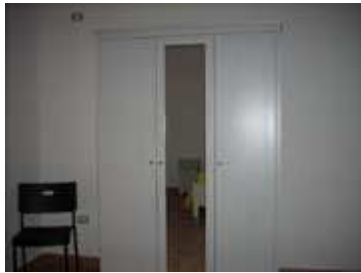
Armadio nella camera letto