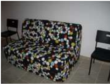
divano letto matrimoniale in cucina