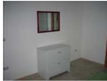
comodino e specchio