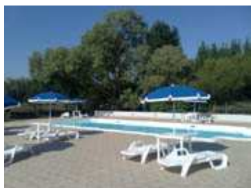
Piscina di giorno