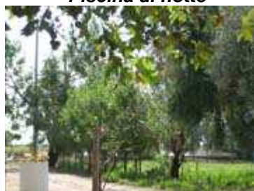
verde vicino la piscina