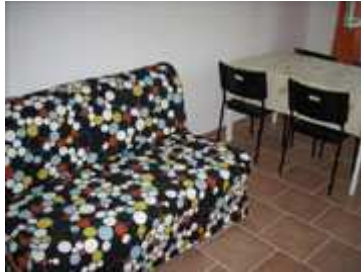
Divano letto matrimoniale