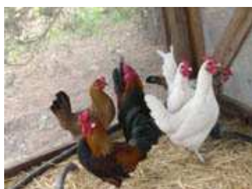
Galline e Polli