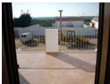
veranda con tavolo, sedie e ombrellone