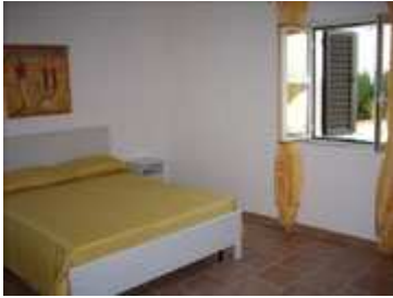
camera con letto matrimoniale