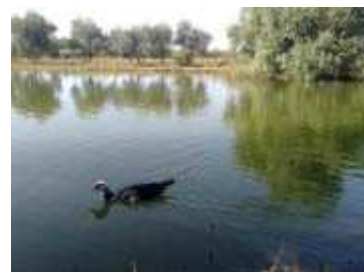
Laghetto con papere