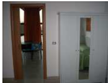
armadio nella stanza matrimoniale e porta per la cucina