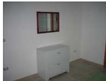
comodino e specchio