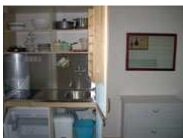
Angolo cottura aperto