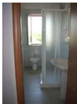
Bagno privato con doccia