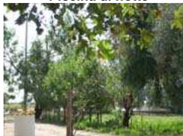
verde vicino la piscina