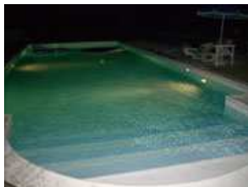
Piscina di notte