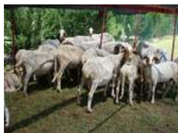
pecore e agnelli