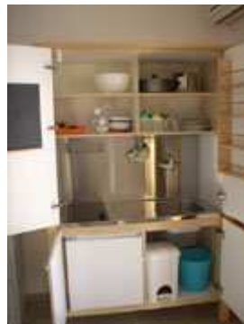
angolo cottura aperto