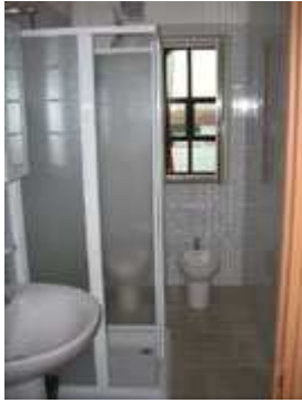
Bagno privato con doccia

Sistemazione E) n. 1 Appartamento al primo piano da circa 42 metri quadri (App. n.6 da massimo 4 adulti + 1 bambino)