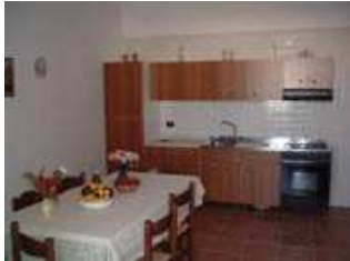
Kitchen – Cucina

Sistemazione A) n. 3 Appartamenti al piano terra da 55 metri quadri (App. n.1-2-3 da massimo 5 persone adulte ad appartamento)