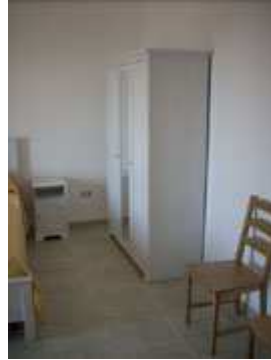
armadio e comodini