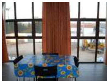
tavolo e la vetrata in cucina