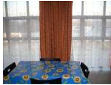
in cucina con le tende chiuse per maggiore privacy