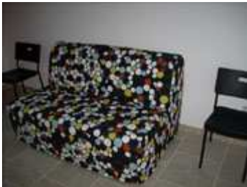
divano letto matrimoniale in cucina