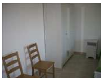
armadio e comodini