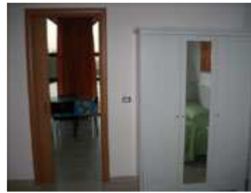
armadio nella stanza matrimoniale e porta per la cucina