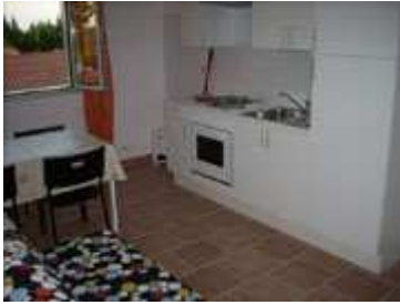
Cucina, tavolo e divano letto matrimoniale

Sistemazione D) n. 1 Appartamento al primo piano da circa 42 metri quadri (App. n. 4 da massimo 4 persone adulte + 1 bambino)