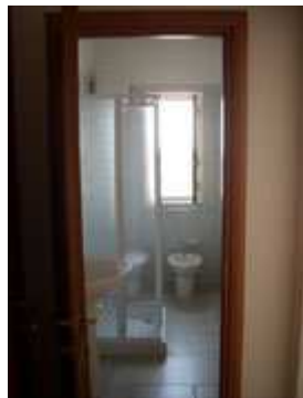
bagno privato con doccia