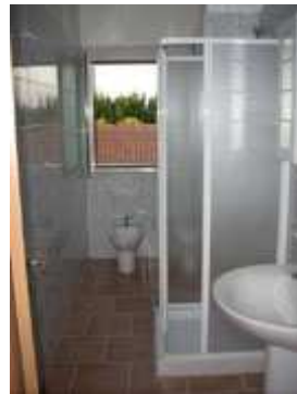
Bagno privato con doccia