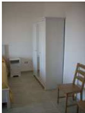
armadio e comodini