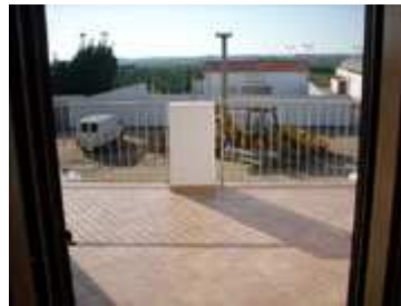
veranda con tavolo, sedie e ombrellone