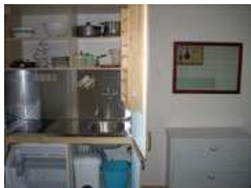
Angolo cottura aperto