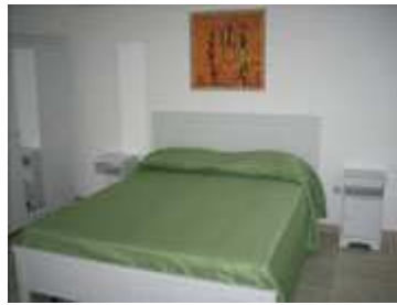
stanza con letto matrimoniale