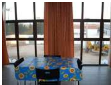
tavolo e la vetrata in cucina