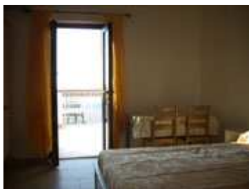
tavolo e porta per veranda