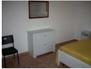
Comodino e specchio nella camera letto