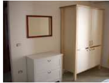
angolo cottura e comodino