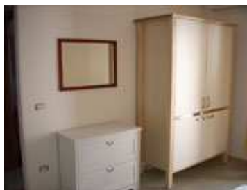
angolo cottura e comodino