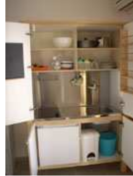
angolo cottura aperto