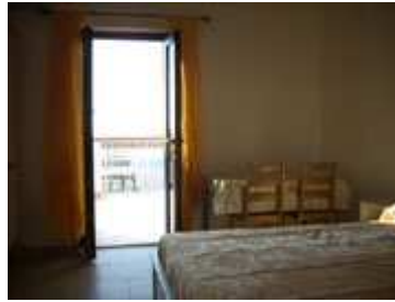
tavolo e porta per veranda