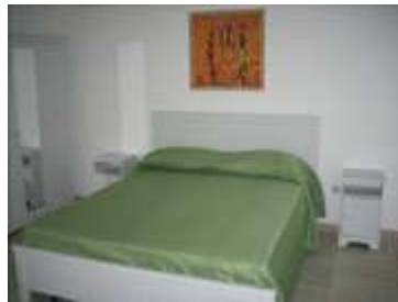
stanza con letto matrimoniale