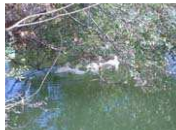
Laghetto con papere