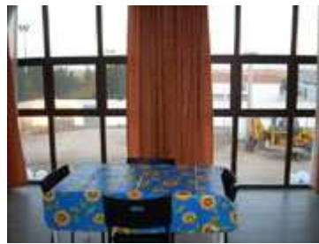
tavolo e la vetrata in cucina