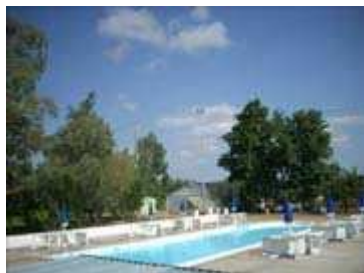
Piscina di giorno