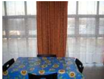
in cucina con le tende chiuse per maggiore privacy