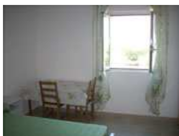
tavolo e finestra